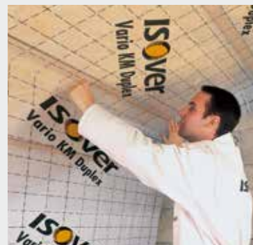
Fig. 4 Breng een lucht/dampscherm aan, zoals ISOVER vario® KM duplex.

Appelez un pare-vent/ vapeur, comme l'ISOVER vario® KM duplex.