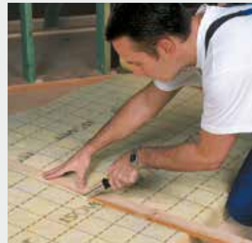
Fig. 2 Snij de gewenste breedte langs de maatstrepen af met een lat en het ISOVER isolatiemes.

A l'aide du couteau ISOVER coupe laine et d'une latte, coupez à dimension en suivant les prémarquages.