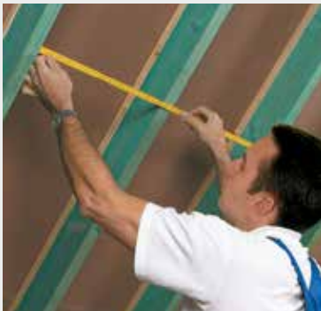
Fig. 1 Meet de ruimte tussen 2 kepers en voeg hier 1 à 2 cm aan toe. Mesurez la distance entre 2 chevrons et ajoutez-y 1 à 2 cm.

L'application d'un pare-vent/vapeur est indispensable pour assurer l'étanchéité à l'air et à la vapeur d'eau (fig.4). Le pare-vapeur à base de polyamide au pouvoir asséchant est décrit dans la fiche ISOVER vario® KM duplex.