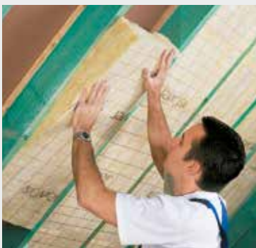
Fig. 3 Klem de isolatie tussen de kepers. Coincez l'isolation entre les chevrons.

A l'aide du couteau ISOVER coupe laine et d'une latte, coupez à dimension en suivant les prémarquages.